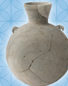
須恵器 提瓶 (西野々遺跡)