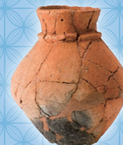
弥生土器 壺 (西野々遺跡)