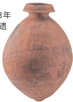
香南市东野土居遗址出土的 弥生土器壶 弥生时代后期

从平成24年起,公益财团法人高知县文化财团埋藏文化财中心除了原有的挖掘调查业务之外,受高知县委托,作为指定管理者进行设施的管理与运营工作。