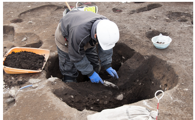
1W区総柱建物跡の大型柱穴掘削作業風景