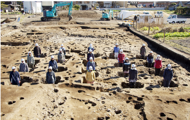
1W区大型柱穴を持つ総柱建物跡