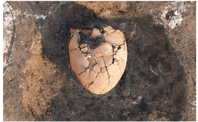
I W区弥生土器甕出土状況