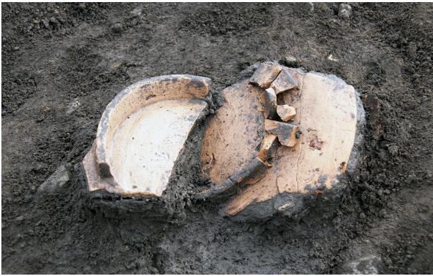
I W区土師器出土状況